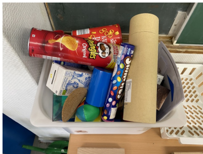
Kiste mit Gegenständen